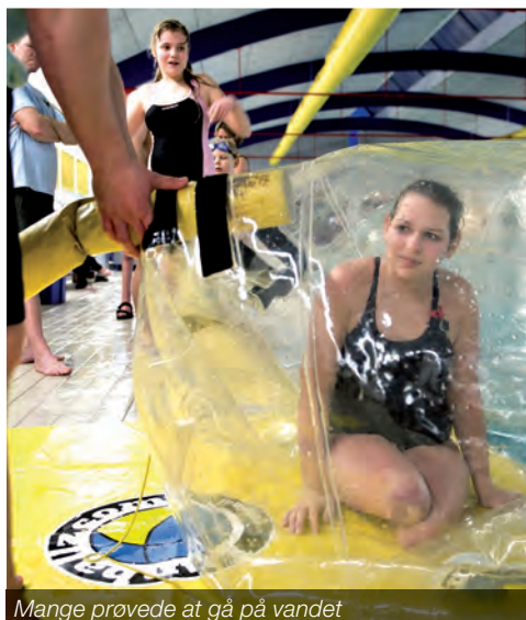
Mange prøvede at gå på vandet

Jubilarer i alle aldre mødte talstærkt frem fra eftermiddagen af for at fejre HASA den 28. februar med lagkagekonkurrence, gøgl og vandgang. Se flere billeder fra festen på side 15, 23 og 25.