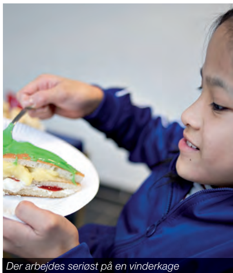
Der arbejdes seriøst på en vinderkage