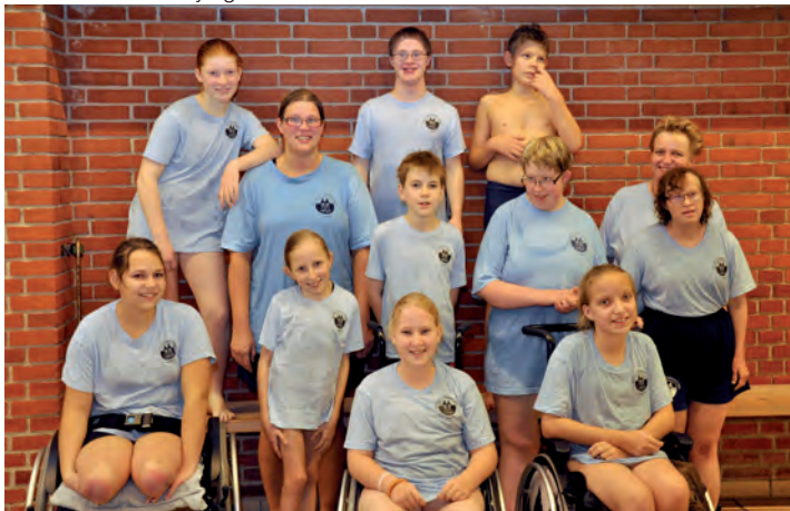
HASA-holdet i Esbjerg november 2011