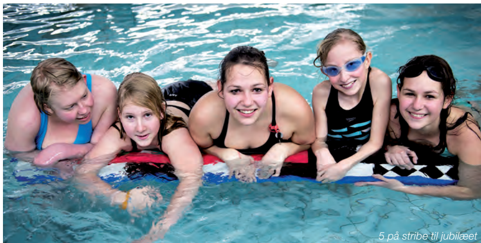
5 på stribetil jubilæet