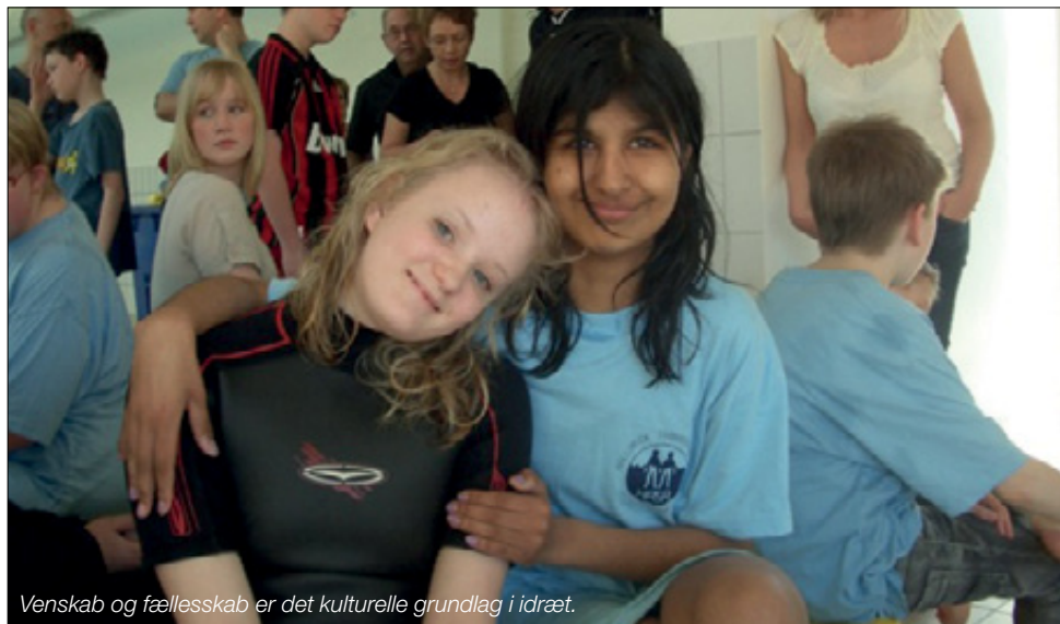
Venskab og fællesskab er det kulturelle grundlag i idræt.