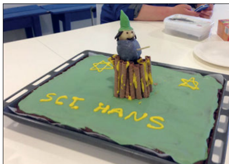
Simones Sct. Hanskage fra 2013.