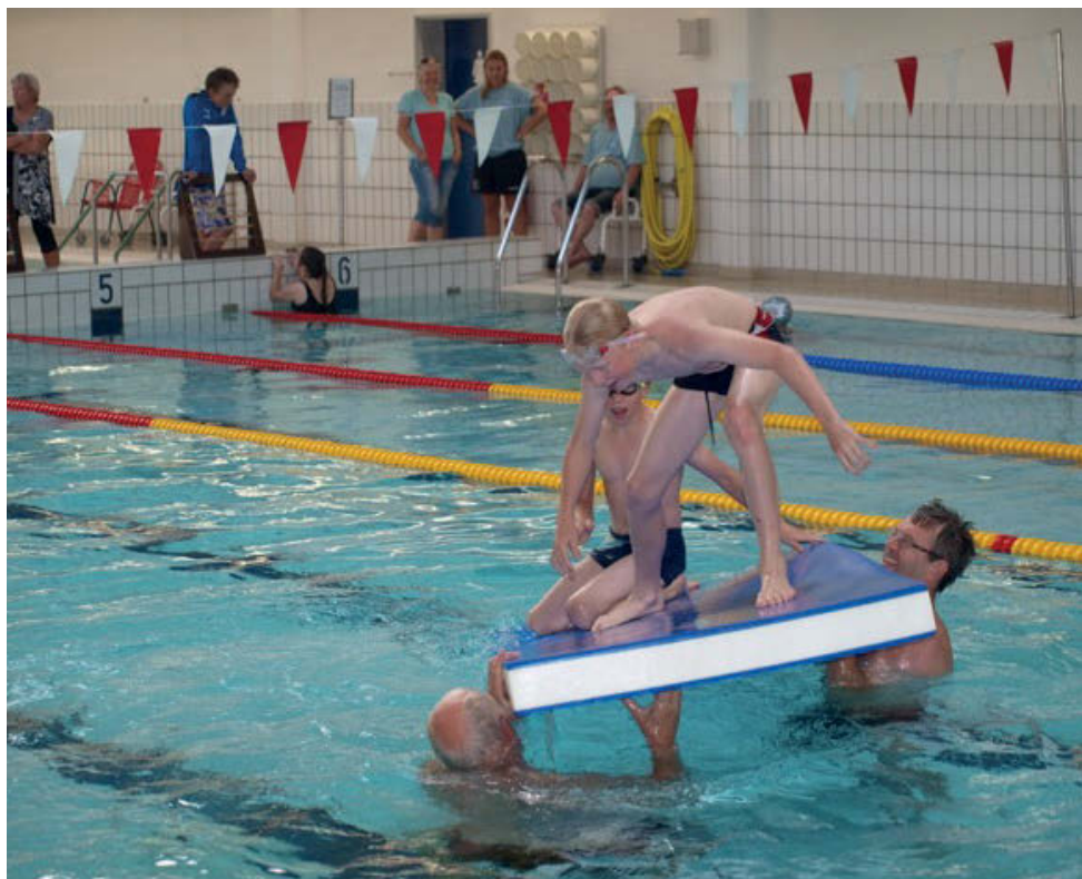
Nye vandkunster øves sidste svømmeaften inden sommerferien