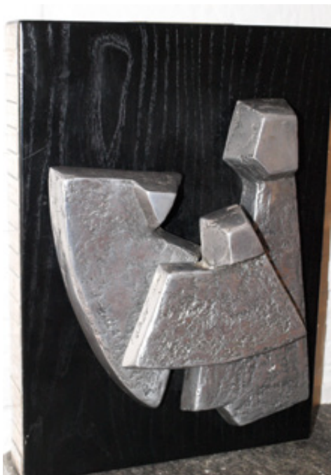
HASA kom i mål som nr. 40 i Marselisløbet 2014.

I forbindelse med dette års Marselisløb blev HASA hyldet med den plakette, I ser på billedet. Men hvad forestiller trofæet? Maveplask gik til sagkundskaben, som sædvanligvis udfolder sig på hylderne i damesaunaen.