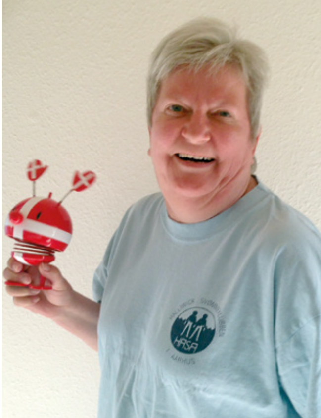
Traditionen tro vil HASA også fremover hædre en af klubbens mange ildsjæle med Hoptimistprisen på den årlige generalforsamling.

I den forløbne sæson har der været en del snak blandt HASAs medlemmer om, hvem der skal have gaver i anledning af jubilæer, runde fødselsdage og "farvel og tak", og hvem, der ikke skal og hvorfor ikke og så videre og så videre.