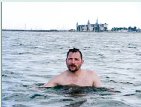
Morten med Kronborg om styrbord.