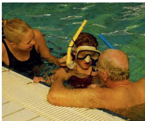
Vi skal i dybden.

Desværre lykkedes det ikke at få tilstrækkeligt med tilmeldinger til vor sommerudflugt med overnatning i august. Det var pengene fra "Frivillighedsprisen", som skulle være brugt til oplevelser på Mols. Styregruppen valgt derfor i stedet, at arrangere et internt kursus for forældre, svømmere, hjælpere etc., som blev afviklet i januar i år. Der var god tilslutning, og deltagerne var meget glade for udbyttet af kurset. Styregruppen tænker derfor på at gentage kurset, da det er væsentligt for klubbens funktion og udvikling, at medlemmerne har god forståelse af Halliwickkonceptets idé og metodik.