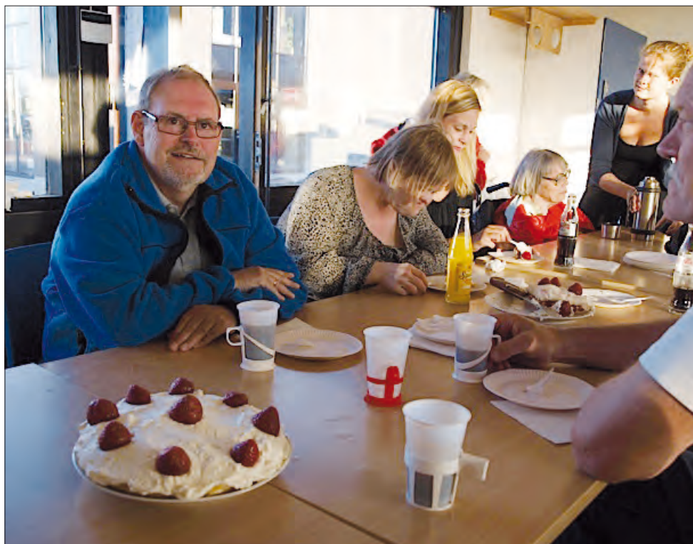
Som I kan se, får vi noget for vores kontingentkroner. Det er fedt at svømme i HASA.

Se hvad de forskellige kontingentsatser dækker på www.hasa.dk