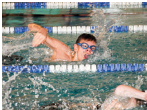
Alexander i hård konkurrence.